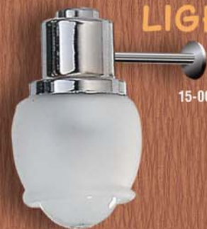
LIGHT SPOT No17 15-0006 SPOT 11,00