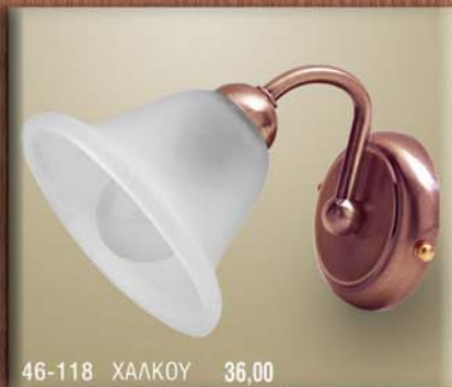
46-118 ΧΑΛΚΟΥ 36,00