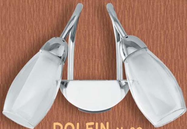
DOLFIN No29 15-66 ΑΠΛΙΚΑ Π 2Χ40W 40,00

ΜΕ ΣΤΗΡΙΞΗ ΘΗΛΥΚΩΤΗ ΕΠΙ ΤΟΥ ΚΡΥΣΤΑΛΛΟΥ ΤΟΥ ΚΑΘΡΕΦΤΟΥ