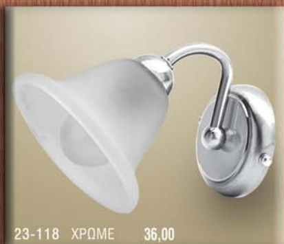
23-118 ΧΡΩΜΕ 36,00