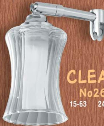
CLEAR No26 15-63 24,00