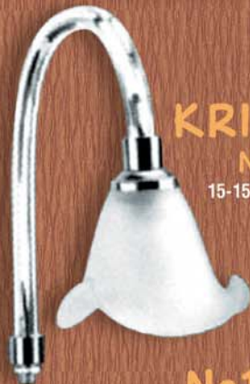
KRISTAL No57 15-157 24,00