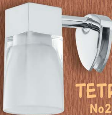
TETRA No21 15-67 24,00