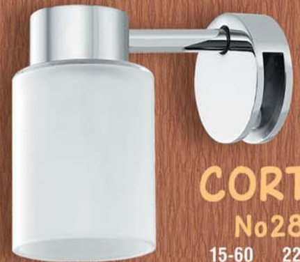
CORTO No28 15-60 22,00