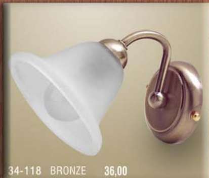
34-118 BRONZE 36,00